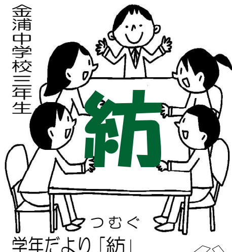
金浦中学校三年生