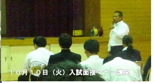
10月10日(火) 入試面接マナー講座