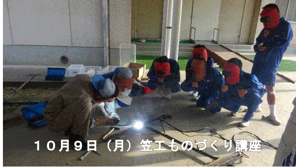
10月9日(月) 笠工ものづくり講座