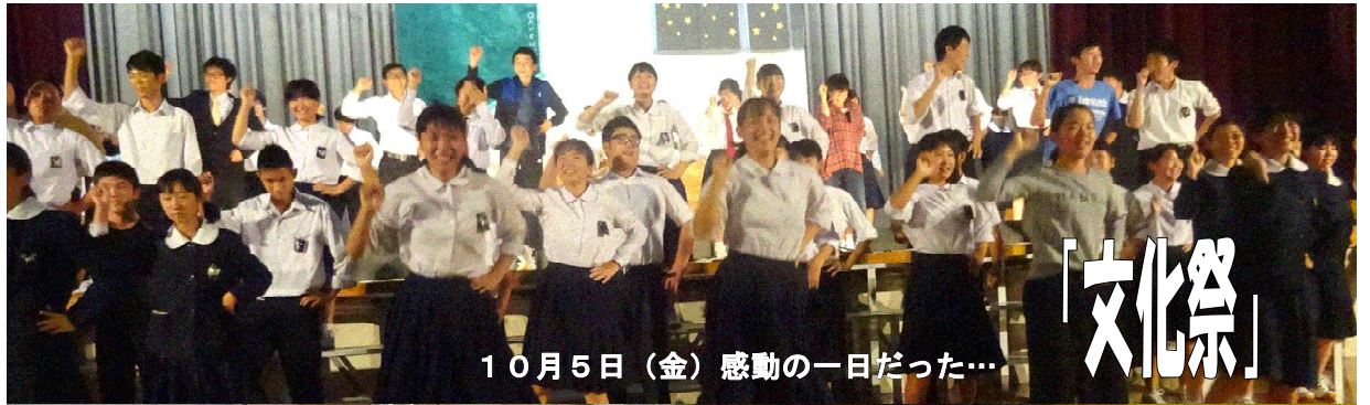
10月5日(金) 感動の一日だった...